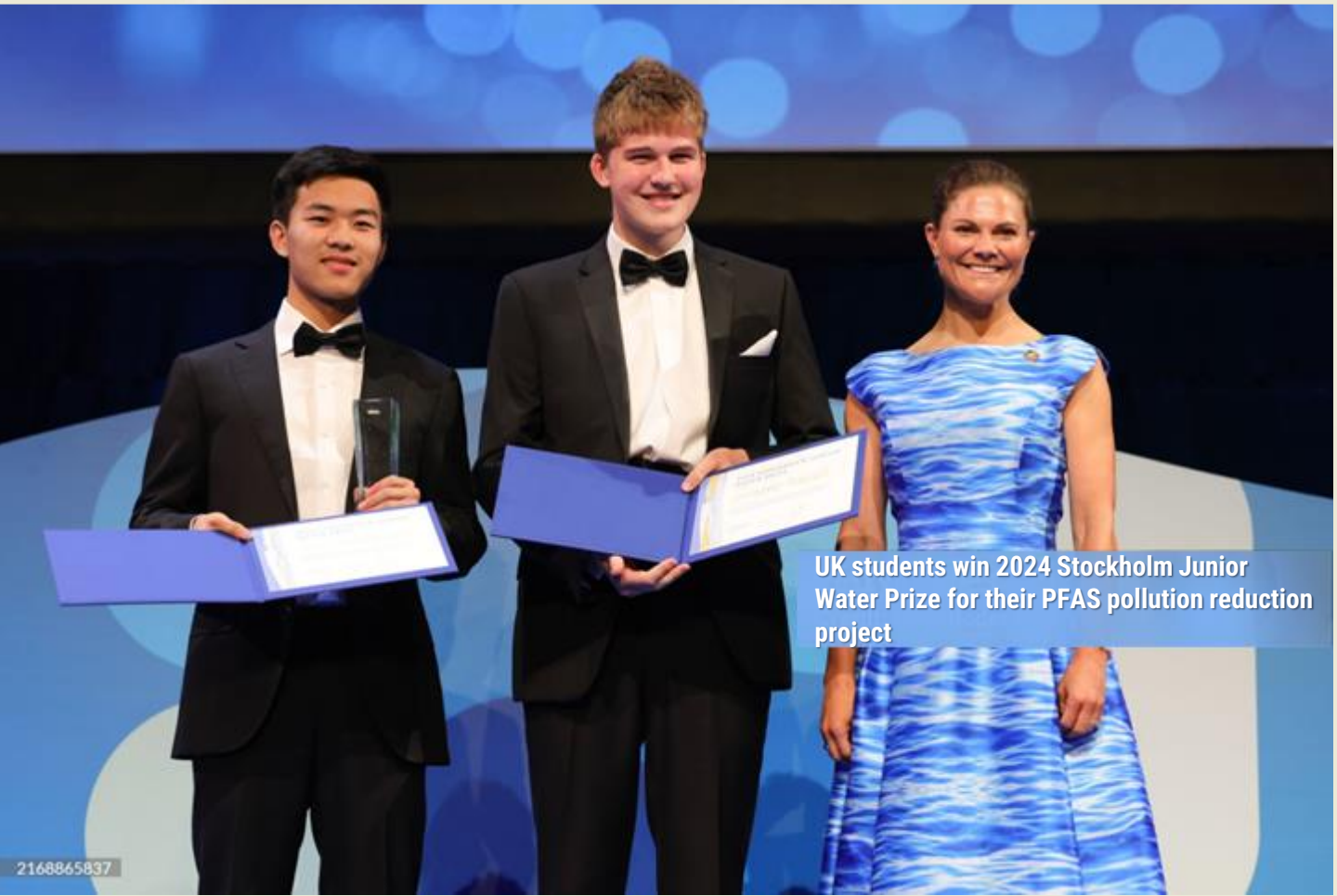
UK students win 2024 Stockholm Junior Water Prize for their PFAS pollution reduction project