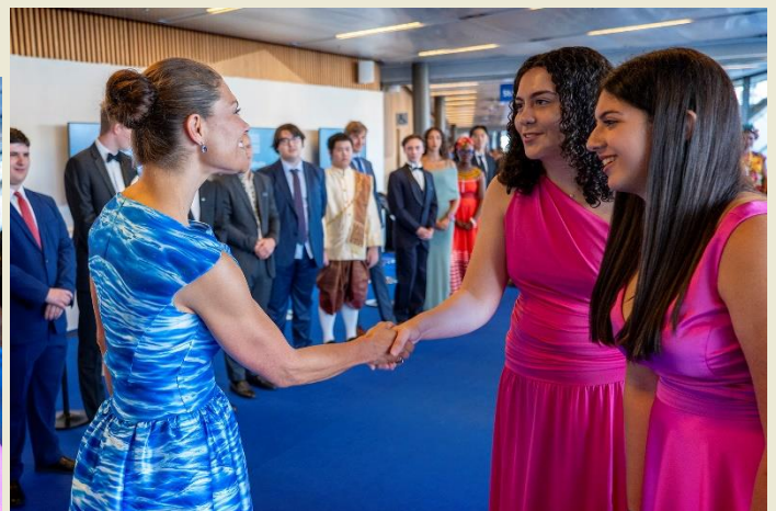
Princess Victoria of Sweden with the students who represented Cyprus in 2024