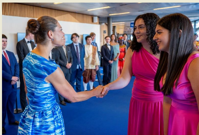
Η Πριγκίπισσα Βικτώρια της Σουηδίας με τους μαθητές που εκπροσώπησαν την Κύπρο το 2024